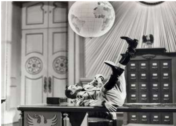
Ο Τσάρλι Τσάπλιν σε σκηνή από την ταινία "Ο μεγάλος δικτάτωρ"